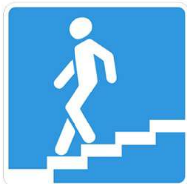
Подземный пешеходный переход