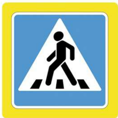
Наземный пешеходный переход